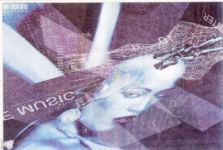
Le programme sPACE, navigable music permet de créer en même temps un morceau et un clip vidéo.

Lorsque [Erzatz] se promène dans cet environnement de réalité virtuelle, en même temps qu'il tisse son ambiance sonore, il génère des séquences d'images issues de Ghost in the Shell , Tron , 2001: l'Odyssée de l'espace ou Matrix . Sur le Net, l'utilisateur peut déjà intégrer ses propres sons et aura bientôt la possibilité d'incorporer ses images et de créer ainsi son univers. sPACE, navigable music permet d'enregistrer ses mouvements et de rejouer l'animation générée. Ce programme nécessite toutefois un PC puissant avec une bonne carte graphique 3D et un son stéréo, à défaut de la quadriphonie. A terme, sPACE, navigable music devrait fonctionner dans un espace commun où chaque internaute serait représenté par un avatar contenant sa propre ambiance musicale et visuelle, qu'il partagerait avec les autres internautes, connectés au même moment. ● MARIE LECHNER (Bruxelles, envoyée spéciale)